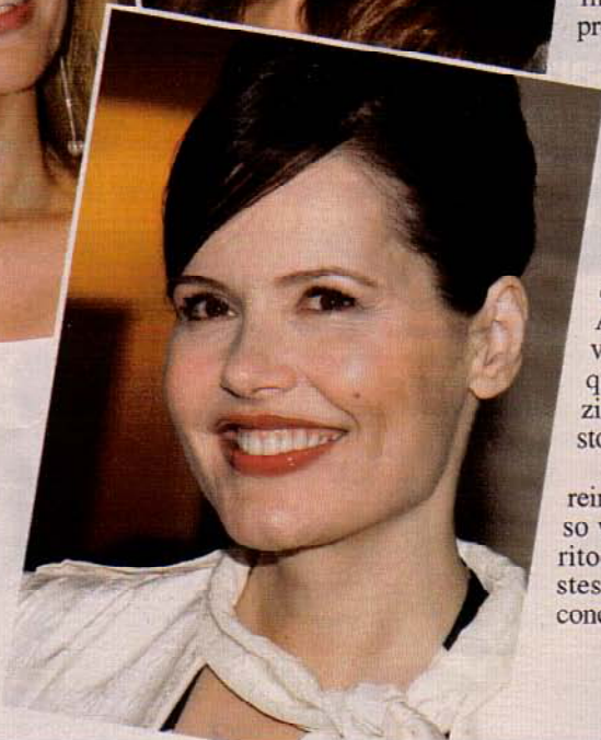
Dall'alto, Sharon Stone, 49 anni, Sabrina Ferilli, 42, Rita Rusic, 47, e Geena Davis, 51. Quattro donne naturalmente toniche.